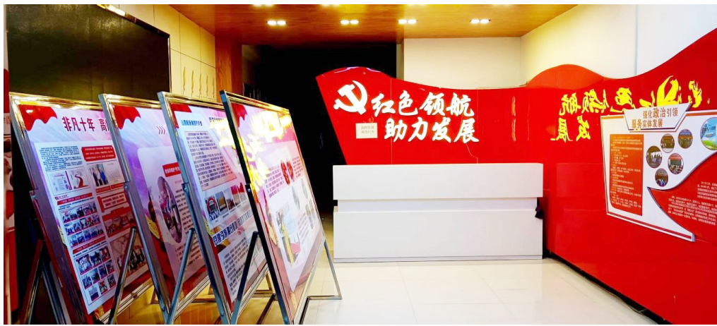
▲定襄县委非公经济和社会组织工委党群服务中心。

强化保障落实,夯实阵地基础。建立多渠道筹措、多元化投入的经费保障机制,及时按标准下拨配套党建经费;推行企业党员工资比一般职工