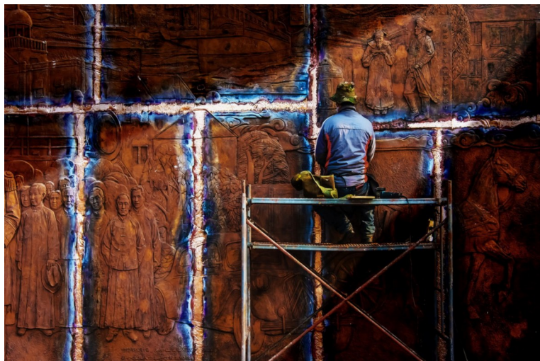
“印象新江南”职工摄影大赛金奖作品《修复中的思考者》。(安徽省宣城市总工会选送)