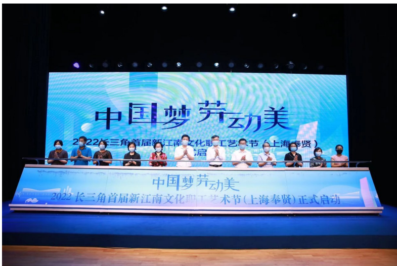
2022长三角首届新江南文化职工艺术节(上海奉贤)于8月12日正式启动。

“中国梦·劳动美”首届长三角新江南文化职工艺术节(上海奉贤)将于本周在上海市奉贤区九棵树未来艺术中心圆满闭幕。此次职工艺术节在上海市总工会和上海市奉贤区委、区政府的大力支持下,奉贤区总工会携手浙江省温州市总工会、嘉兴市总工会,江苏省扬州市总工会、镇江市总工会,安徽省芜湖市总工会、宣城市总工会、马鞍山市总工会和亳州市总工会共同主办,为长三角地区的职工提供了互相交流、互相学习、互相提高的平台,也为更多职工带来一场精彩纷呈的“云端”文体盛宴。