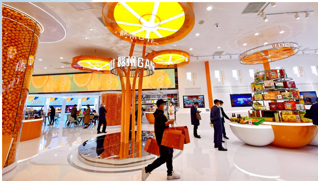
▲江西省赣州市城市会客厅(赣州馆)占地342平方米,以赣州市著名农产品——赣南脐橙为核心设计元素,通过将赣南脐橙的形、色、味进行提取、凝练、创意,以一幅层层递进的赣南脐橙之乡城市会客厅画卷,展示赣州市的风土人情、乡村振兴、产业发展新面貌。图为11月5日,不少参观者来到进博会的赣州馆咨询洽谈采购,体验感受赣南客家风土人情。

东海之滨,黄浦江畔,第五届中国国际进口博览会(以下简称“进博会”)如约而至。作为世界上首个以进口为主题的国家级展会,进博会充分发挥国际采购、投资促进、人文交流、开放合作四大平台作用,已成为构建新发展格局的示范窗口、高水平开放的推进平台、高质量发展的有效载体、多边主义的重大舞台。世界目光聚焦上海,第五届进博会有何看点?近日,中国城市报记者进行了实地走访。