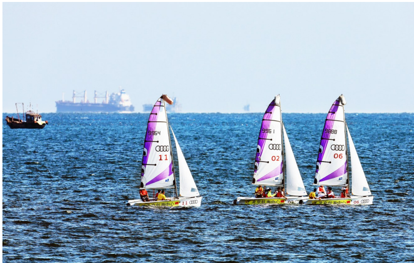
河北省秦皇岛市坚持向海发展、向海图强,创新生态产品价值实现机制,推动生态资源转化为生态资本、生态红利。图为位于秦皇岛市北戴河新区的北京航海中心。

秦皇岛市还以创建国家全域旅游示范区为抓手,有效激发滨海休闲旅游带和长城文化体验带活力与吸引力;加强传统景区改造升级,聚力打造野生动物园、好莱坞魔法城、渔岛度假温泉等国家精品旅游景区,全力创建北戴河国家级旅游度假区、北戴河新区康养度假等文旅品牌,打造世界级文化古城、世界级度假海岸,形成“全民参与一生态改善一富民强市一海湾环境更好”的良性循环新局面。(本文根据秦皇岛市委办公室所供相关材料整理)