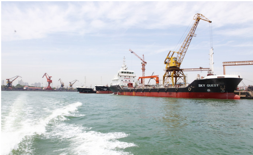
河北省秦皇岛市聚焦美丽海湾保护与建设,统筹山水林田湖海沙一体化治理,促进相关产业发展和市民幸福感提升。图为秦皇岛市新开河港生态和谐景象。