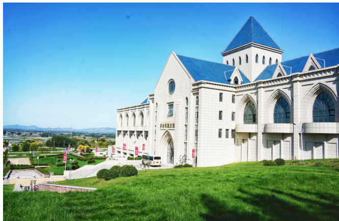
河北省秦皇岛市昌黎县充分运用滨海优势和山地资源,培育发展特色葡萄酒产业,促进了农文旅融合和乡村全面振兴。图为昌黎县茅台凤凰酒庄。