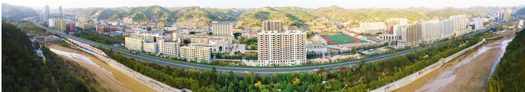
陕西省榆林市子洲县城全景。

夏日清晨，在子洲县的中心广场上，太极拳协会的成员们正在神情专注地演绎着握拳、转腿、冲拳等一招一式，开合有序、刚柔相济；热爱舞蹈的市民们，正手拿彩扇或花伞，踏着铿锵有力的锣鼓节拍，扭起了陕北大秧歌，更扭出了热闹红火的幸福新生活。