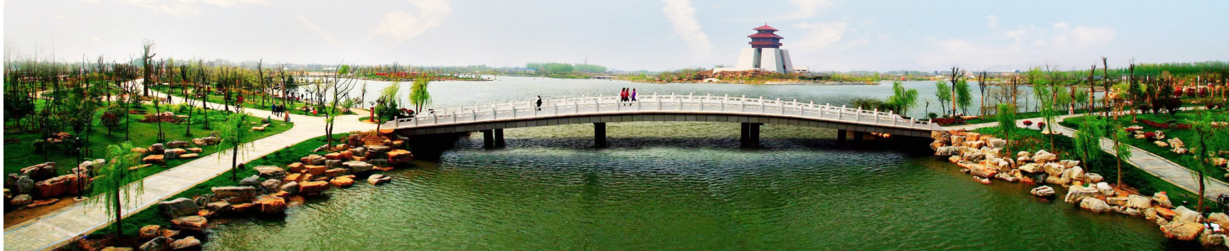
枣庄市市中区东湖公园景色怡人。

汇聚新兴业态力量，扩大“朋友圈”。强化新就业群体阵地建设，依托网格“红色驿站”，打造快递、外卖小哥“红·暖”之家16处，绘制“红·暖”之家空间分布图，常态化提供暖餐服务、饮水休憩、避暑清凉、休闲阅读、充电充气等“10+X”暖心服务，打造“15分钟服务圈”。健全“抓行业、行业抓”工作机制，成立外卖送餐行业综合党委，出台《市中区关于党建引领外卖送餐行业高质量发展的若干措施(试行)》，从5个方面15条具体举措入手，规范外卖送餐行业高质量发展。加强人员力量，选派6名两新组织党建工作专员，派驻至快递物流、互联网、二手车等行业部门主管的两新组织驻点指导；编制包含5方面31项具体内容的指导手册，明确4大目标任务和10项具体职责，让每名专员都成为“政策通”“明白人”，实现上马即干、起步冲刺。