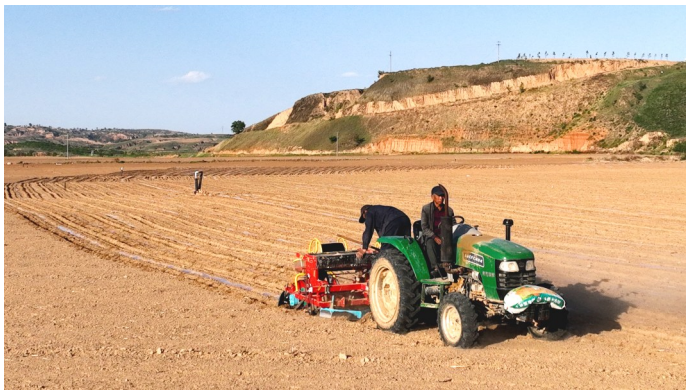
陕西省榆林市府谷县岳家寨村高标准农田中的拖拉机正在耕作。

府谷县哈镇按照“农业稳镇、生态立镇”的发展思路，立足镇情实际，狠抓农业产业，围绕“育苗、牧草、小杂粮、海红果、退耕还林”“五个万亩”工程，因地制宜实施“一村一产业”工程。先后建成店塔村传统陈醋厂，陈家圪堵村黄油加工厂，大岔村海红果加工厂，硬路塔村特色果蔬采摘园、湖羊养殖场，鱼儿沟村高产苜蓿示