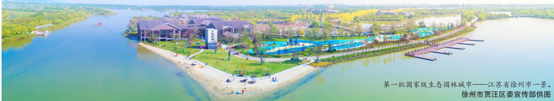
第一批国家级生态园林城市——江苏省徐州市一景。

“近期应树立融合观——生产、生活、生态三类空间并非应该是简单的分区、独立和各自限定,而应是融合的关系。”贺文龔表示,“而远期应树立系统观。生态是一个复杂的系统,但至少我们可以先形成若干的子系统,比如由海绵城市到生态雨洪系统、由慢行交通到绿色出行系统、由多样物种到和谐共生的生物系统,依次来构建绿色和谐的城市大园林。”