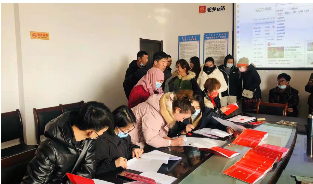
内蒙古自治区阿拉善左旗巴彦浩特镇巴彦霍德嘎查村民正在领取集体经济分红款。

巴彦霍德嘎查还制定完善了《村规民约积分制及绩效考核管理办法》,与农牧民签订承诺书,明确2022年嘎查集体经济分红将根据卫生治理、尊老爱幼、邻里和睦等方面情况考