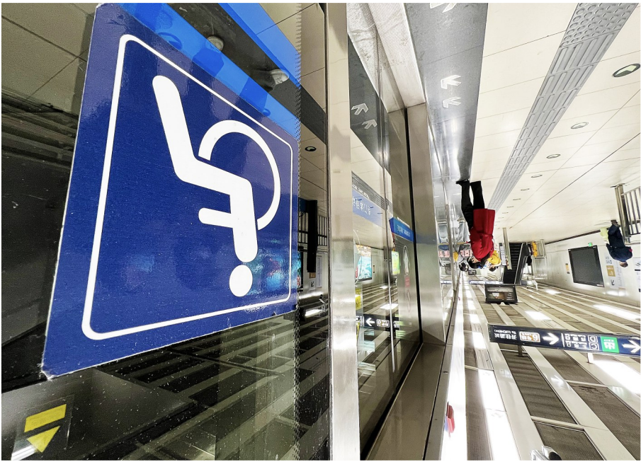
北京地铁10号线无障碍标识。