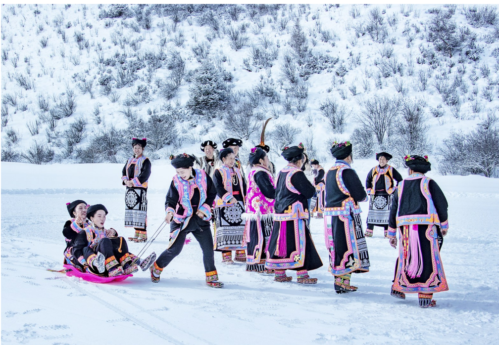
1月13日,“圆梦冬奥·共享未来”第八届全国大众冰雪季暨四川省第四届全民健身冰雪季在四川阿坝藏族羌族自治州理县鹧鸪山自然公园启幕,本季的主题为“全民迎冬奥”。图为羌族群众体验冰雪项目。