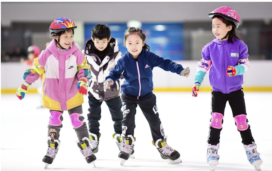
近日,内蒙古自治区呼和浩特市中小学校学生免费冰上体验活动在呼和浩特体育中心综合体育馆展开,学生们在专业教师的指导下,学习冰上运动,了解冬奥冰雪文化,感受冰上运动乐趣。