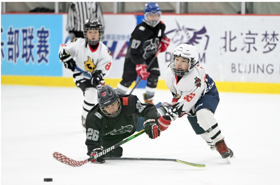
周末,北京的少年儿童在北五环附近的一处冰场进行冰球对抗。