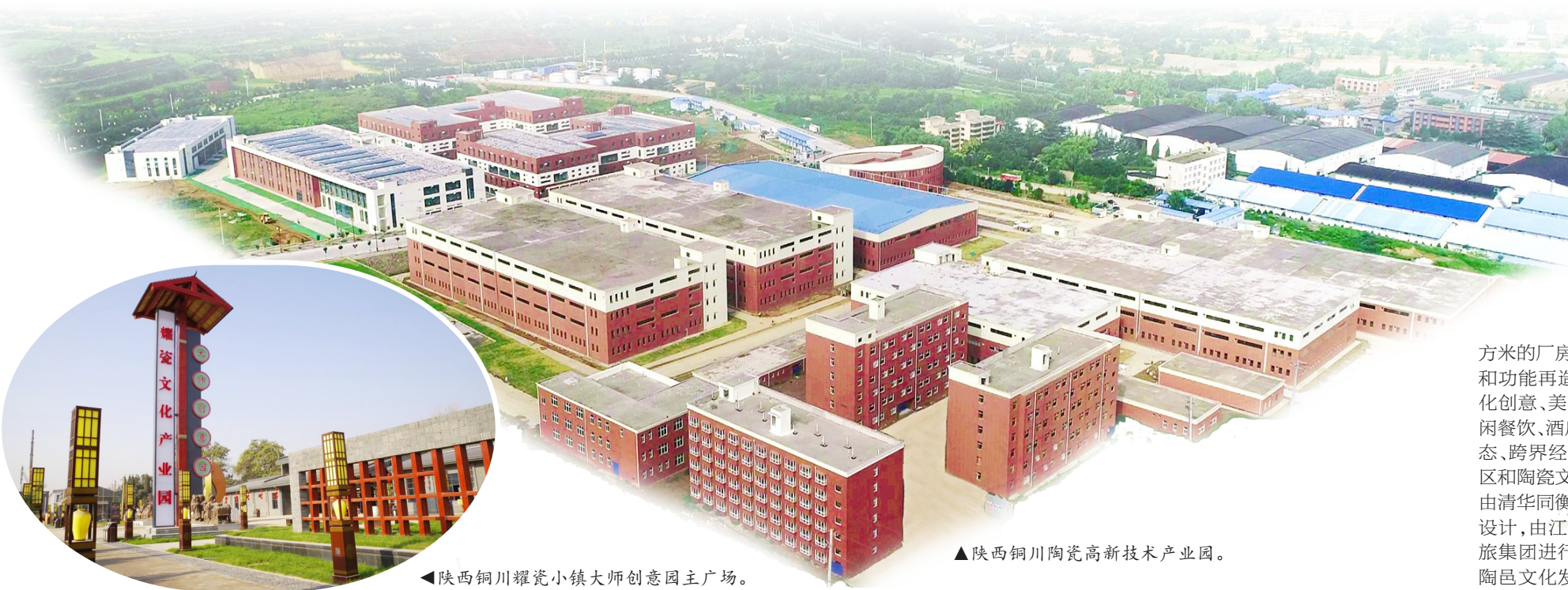
▲陕西铜川耀瓷小镇大师创意园主广场。