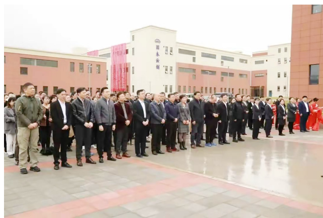
陕西国本云创项目投产仪式在铜川陶瓷高新技术产业园举办。

管委会将坚定发展先进陶瓷产业方向不动摇，坚持“资金优先支持、资源优先倾斜”“围绕产业链部署创新链，围绕创新链布局产业链”，努力建设好铜川陶瓷高新技术产业园。