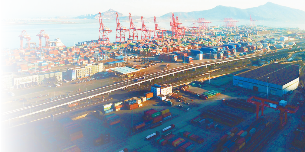
2021年12月31日，江苏连云港港口一片繁忙景象，大批集装箱等待装船出口海外。

在陈耀看来，长三角的中心城市上海对周围区域的经济带动作用。江苏沿海地区总体处于苏中、苏北地区，距离上海较远，接受中心城市辐射带动效应较弱，因此整体上发展相对滞后。