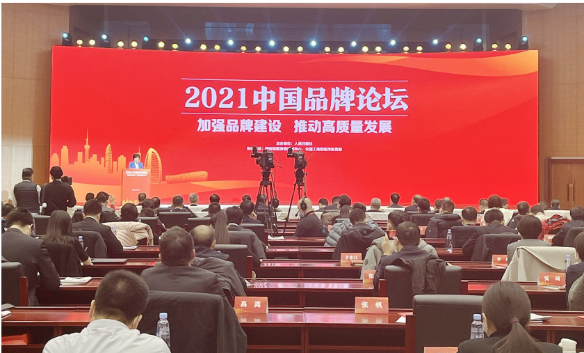
2021 中国品牌论坛现场。

田世宏介绍,截至目前,已实施自我声明公开的企业标准超200万项,有力激发企业增品种、提品质、创品牌的内生动力。