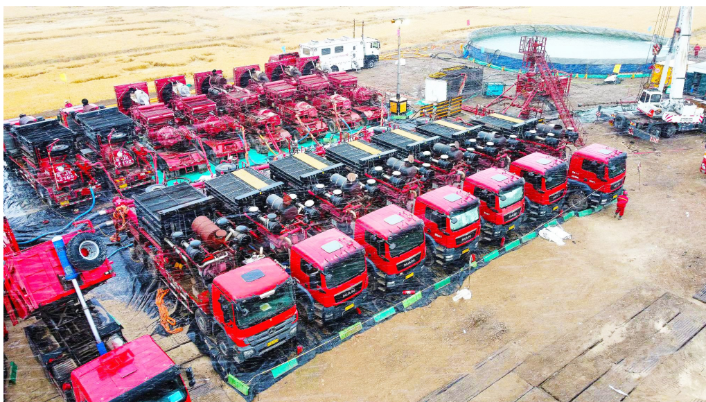
中石油渤海钻探井下作业公司YS43034队正在施工的吉林乾188G平3井作业现场。

成功实施山西首口石墨烯渗透石体积压裂；圆满完成乾188G平3井压裂施工，刷新吉林页岩油市场单井施工段数、泵注液量两项新纪录……11月份以来，中国石油渤海钻探井下作业公司（以下简称井下作业公司）不断取得技术突破，喜讯连连。“前三季度，实现提质增效8514万元，完成年度目标的160%。”井下作业公司党委书记、执行董事孙海林说。