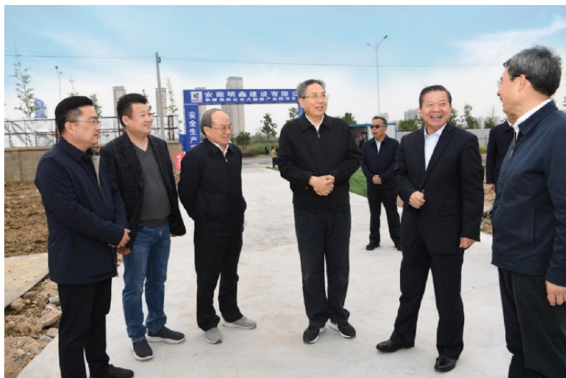
2020年4月，安徽省委书记李锦斌一行到淮南云谷大数据产业园调研。

淮南高新区坚持“经济发展、交通先行”原则，从织密路网着手，拉动山南区域加速发展。目前，已建成连接老城区的洞山隧道和“五横十纵”的主干路网体系，合淮阜、济祁等4条高速公路环绕园区，京福、京港2条高速铁路横穿园区，高速淮南出口、高铁淮南南站位于园区，可零距离接驳，与合肥新桥国际机场50分钟车程，实现30分钟至合肥，1小时30分钟至南京、武