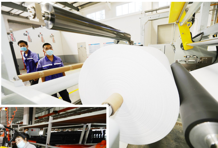
▲位于山东枣庄滕州市高新区正在全速运转的中材科技膜材料(山东)有限公司产品生产线。

据悉，枣庄市围绕高端补链、终端延链、整体强链的思路，带领兖矿鲁南化工、联泓新材料、潍焦能源、泰和科技等龙头