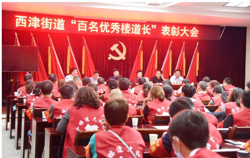
宁国市西津街道召开“百名优秀楼道长”表彰大会。

推动网格共治。全面推进公安、城管、市场监管等执法力量下沉到网格小区,按照1个社区安排9—12名执法人员,每名执法人员联系5—6个网格小区的要求,下沉执法力量147人;细化出台执法进社区工作实施方案,明确网格内执法的职责、清单等内容,推动执法事项属地化管理;通过执法沉到网格、责任落在网格,实现问题解决在网格;加强“红色物业”建设,建立小区党支部、业委会、物业公司三方议事制度,协商物业难题;健全志愿者礼遇实施办法,推行志愿服务积分制度,引导居民参与网格治理,切实构建党建引领、区域融合、多元共治的基层治理新局面。