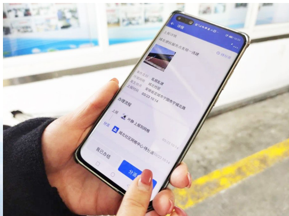
宁国市六级组织为民办事云上平台。