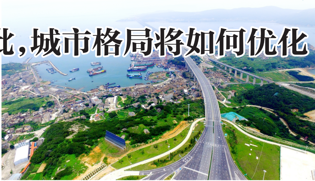
世界最长、中国首座公铁两用跨海大桥——平潭海峡公铁大桥如巨龙般横卧海面。平潭海峡公铁大桥是福平铁路、长乐至平潭高速公路的关键性控制工程，也是国家高速公路网京台线的重要组成部分，正推动平潭国际旅游岛建设加快步伐。图为空中俯瞰平潭海峡公铁大桥。

位，国家发展改革委则提出：“把南京都市圈建设成为具有全国影响力的现代化都市圈，助力长三角世界级城市群发展，为服务全国现代化建设大局作出更大贡献。”