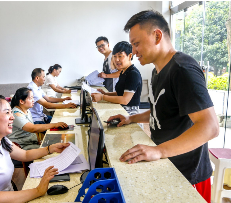
遵义市基层党组织工作者为群众服务。

“从405到28，这并不是说将‘我为群众办实事’的事项减少，由于一个项目涉及多项事实，28个项目有可能牵出上千件事实。”遵义市党史学习教育