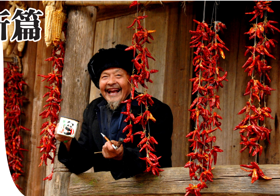
遵义人民火红的日子。

据介绍，“十四五”期间，遵义市将深入实施大生态战略行动，大力发展绿色经济，坚持生态产业化、产业生态化，加快生产生活方式绿色转型，推动绿色经济“四型”产业发展。深入实施绿色制造专项行动，支持绿色技术创新，打造一批绿色企业、绿色园区、绿