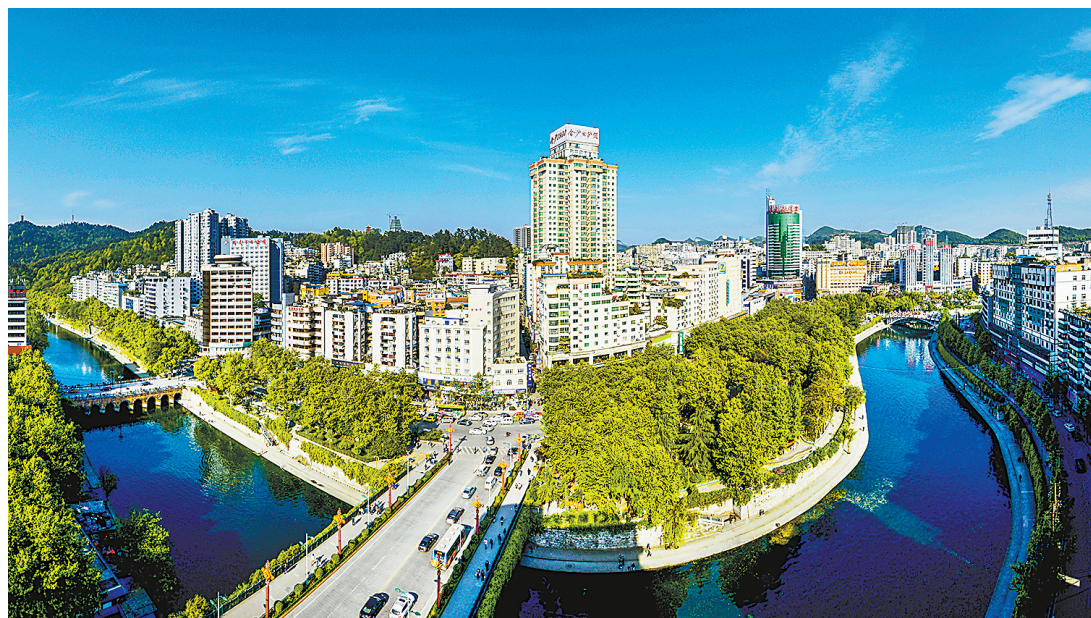
遵义市中心丁字口片区。

遵义是首批国家历史文化名城，拥有世界文化遗产海龙屯、世界自然遗产赤水丹霞，享有中国长寿之乡、中国高品质绿茶产区、中国名茶之乡、中国吉他制造之乡等美誉，曾获得全国文明城市、国家森林城市、国家卫生城市、双拥模范城市、中国优秀旅游城市、