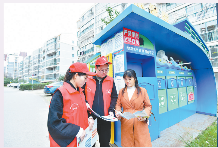
南昌市进贤县城市社区管理委员会组织党员参与社区物业服务。

发挥行业党委统领作用。充分发挥行业协会党委牵头抓总作用,统筹推进物业服务企业党建工作。