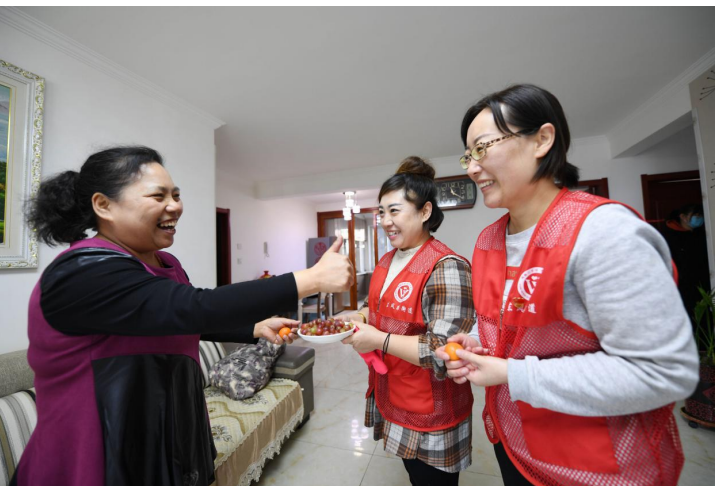
呼和浩特市新城区祥园社区红心送福小分队到居民家中送服务,将爱传遍千万家。

网格员,一个平凡得不能再平凡的岗位,却与辖区居民生活有着千丝万缕的联系。“一张网”装的都是老百姓柴米油盐的琐碎事;“小格子”记录的都是小区每个角落的所需所盼。新城区网格员始终坚持在平凡的岗位上贡献着不平凡的力量,他们带着新理念和思想深入网格、融入网格,“精细化管理,贴心式服务”不再是一句口号,而是在他们步履之下,踏出一个个坚实的脚印。