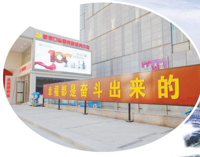
▲南京市新街口商圈党群服务中心。