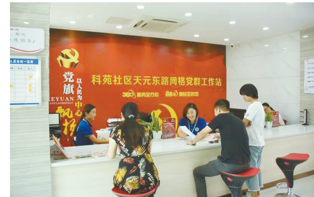
南京市淳化街道科苑社区天元东路网格党群工作站。

考核实施意见和年度考核实施办法，把城市基层党建落实情况纳入考核体系，压紧压实各级党组织管党治党责任；每年压茬组织开展区、街、社区党组织书记抓基层党建述职述职评议，要求对述职中点出的问题层层制定整改方案，实行挂牌督办、对账销账制度，整改一个销号一个；坚持双月随机抽查、半年集中督查等方式，加强对党建工作责任落实的督促检查，发现问题及时通报或约谈；同时，切实强化考核结果运用，把评价结果作为评优评先、选拔任用干部的重要依据，注重把善于谋划会抓党建、善于推进真抓实干的干部选拔出来、重用起来。