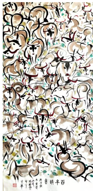
百牛送吉 张学智画