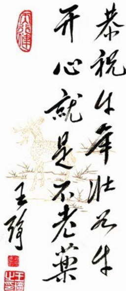
【注】中国工程院院士、国医大师王琦辛丑岁首墨宝祝福。

【注】作者系中国工程院院士，天津药物研究院名誉院长、终身首席科学家和学术委员会主任，中国-东盟传统药物国际合作联合实验室主任，国家科技奖励评审专家、国家药监局中药监管科学研究中心专家委员会主任，我国药代动力学学科开拓者和学科带头人之一。