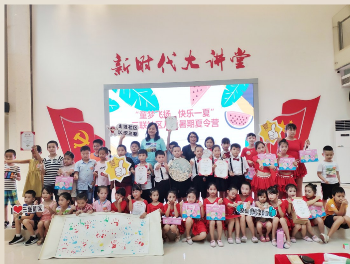
龙华区三联社区党委“民生微实事”项目开展儿童暑期夏令营活动。

推广线上线下“来深第一课”,加强市情区情、历史文化、公共安全等方面宣传培训,帮助来深人员更快更好融入深圳;各级党群服务中心推出“来深建设者服务套餐”,提供文体活动、婚恋交友、技能培训等服务,让外来人口感受到社区的温度,增强城市向心力。