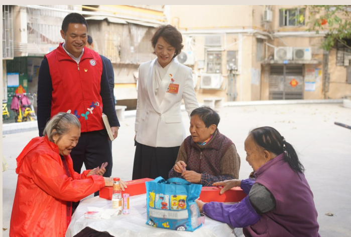
罗湖区桂木园社区开展“党代表进社区”活动。

把关爱暖到一线。出台激励广大党员干部担当作为的12条措施和关心关爱社区一线工作人员10条措施,表现突出的社区党委书记使用事业编制年限减半为3年,为社区工作人员及其家属购买11.2万份防疫专项保险。2个社区、10名社区党委书记获评全国、省抗击新冠肺炎疫情先进集体、先进个人、“广东好人”等荣誉称号。