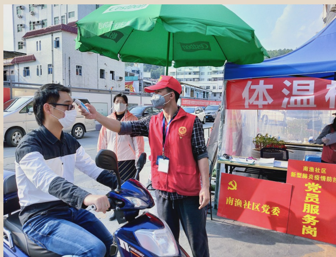
大鹏新区南澳社区党员志愿者在值守卡点为居民测量体温。

主责主业,聚焦抓党建、抓治理、抓服务,全面取消街道承担的招商引资等职能及考核指标,建立街道事项“准入门槛”;实现“大部制”机构设置,设置7-9个综合性机构,相比改革前减少近一半;树立基层导向,下达街道2250名行政执法编制,街道公务员较改革前增加39.8%,街道干部待遇比市直机关同层级干部高20%;赋予街道对派驻街