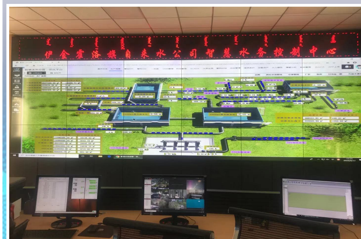
伊金霍洛旗智慧水务指挥中心。

在伊金霍洛旗采访期间,记者深刻感受到这座西部煤城对于“智慧城市”的青睐,也看到了这里正在发生的变化。“让大数据产业助力智慧城市建设,从而实现优化区域经济发展结构和提升政府服务能力的目标,让城市更美好,让人民更幸福。”伊金霍洛旗大数据发展局负责人在接受记者采访时表示,未来他们将紧紧围绕新时代国家信息化发展战略,高质量推进新型智慧城市建设,以数据资源采集和开放共享为重点,抓好数据资源的深度整合与开发利用,突出改善民生,切实提高人民群众的获得感、幸福感和安全感,着力打造西北地区县域领域新型智慧城市的典范。