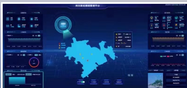
伊金霍洛旗市公用事业管理服务中心打造的阿尔斯伦(“雄狮之眼”)智慧照明管理平台。