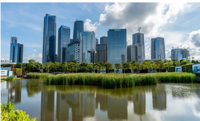
深圳前海自贸区。

今年1至8月,深圳教育、医疗等9大类民生支出1687亿元,占财政支出比重为67.9%。教育经费占财政支出的比重由3年前的13%提升至目前的19%,公立医院平均财政投入占其总收入比重高达32%,而市民就医个人现金支出比重仅14%。