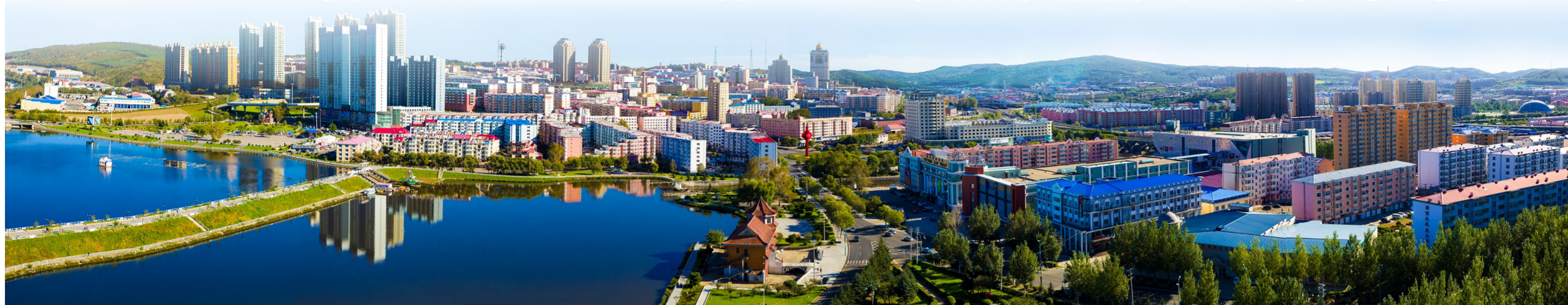
▲绥芬河市秀丽风光。