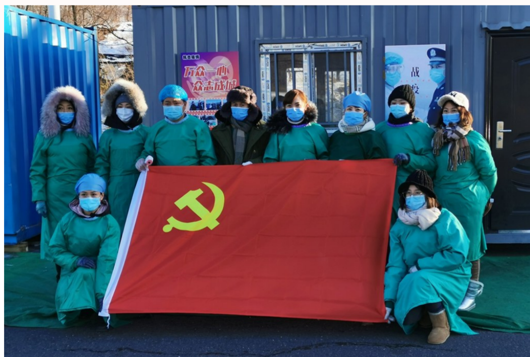
绥芬河市人民医院防疫人员在公路卡口执勤。

已获批卢布使用试点城市和对俄投资结算中心,开通卢布现钞陆路跨境调运通道,实行俄罗斯人进境免签和境外旅客购物离境退税等高含金量国家级政策。