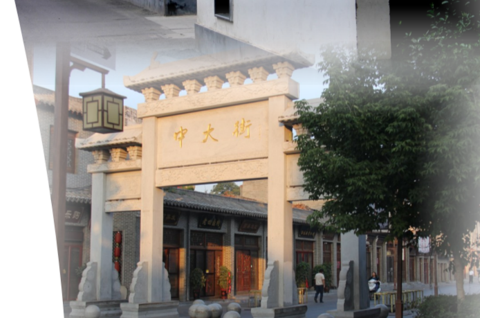
汝州市中大街历史文化街区。