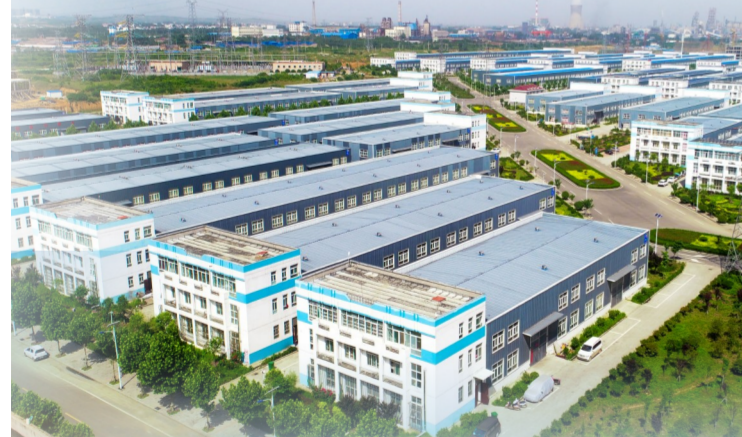
汝州市汝绣产业园。