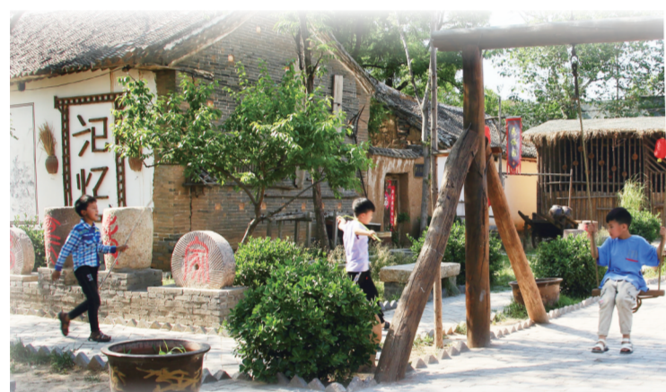
汝州市美丽乡村纸坊镇石桥。