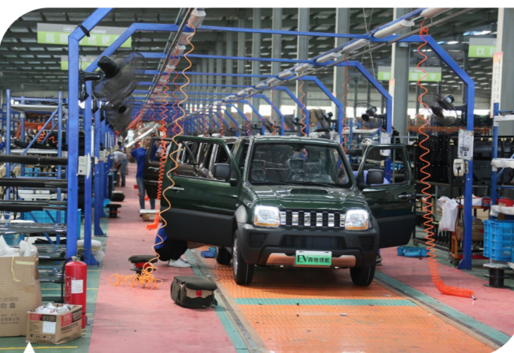
汝州市森地新能源公司电动汽车生产线。

城区内,路畅街净,绿树成荫,活水绕城;乡村间,一村一品,一村一景,一村一韵……汝州城内城外处处洋溢着城乡面貌的新变化。 从大力实施百城建设提质工程,到深入贯彻落实乡村振兴战略,再到加快推进重点镇、特色小镇建设,城乡统筹、多极支撑、竞相发展的城乡融合发展局面在汝州市逐步形成。 作为全省首批百城提质试点县(市)之一,汝州市按照“以水润城、以绿荫城、以文化城、以业兴城”的理念,大力实施道路改造、公共服务提升、环境综合整治、生态水系建设、城市管理提升等工程,扮靓城市容颜,提升城市气质。 交通更畅了。汝州市以构建大交通、畅通微循环为核心,打通断头路,启动道路大修、次干道畅通工程,建设自行车专用道和健康步道,投放公共自行车,成功创建为全省公交优先发展示范市。