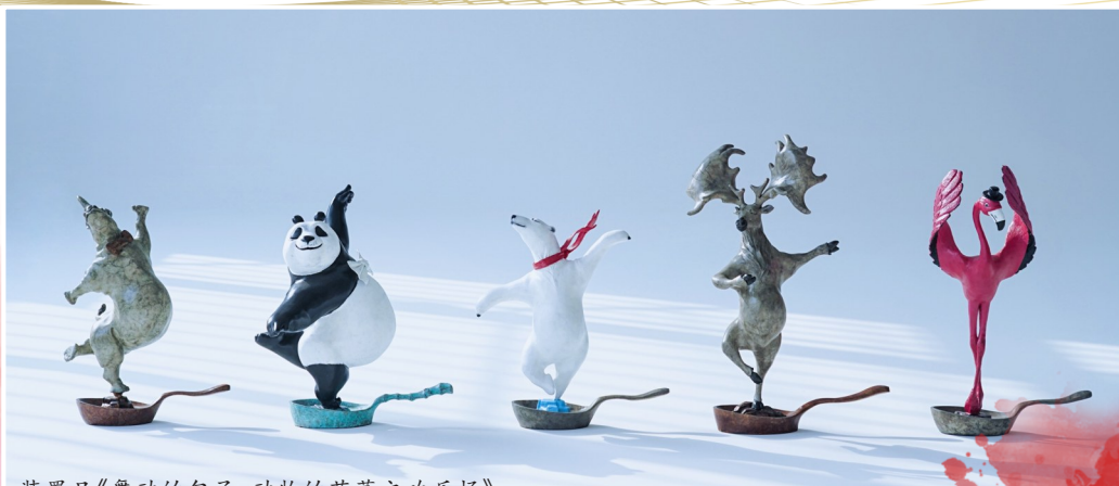
装置品《舞动的勺子:动物的芭蕾之欢乐场》。

翔共同完成,旨在让童真的初心通过视觉传达出来,表现一切生物都像生活在地球上诺大的欢乐