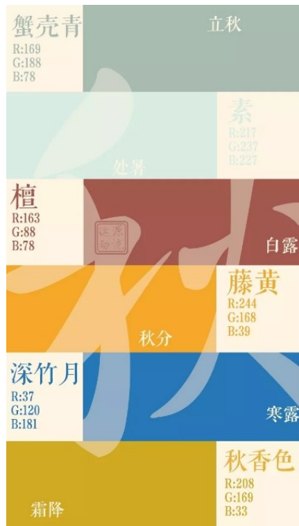
▲自然的笑靥——中国色与24节气文化展。

碰撞、寓意图案给大家呈现了一个二维向三维延展的奇妙空间,是一次雕塑元素和油画装置的巧妙结合,有较强的艺术性。