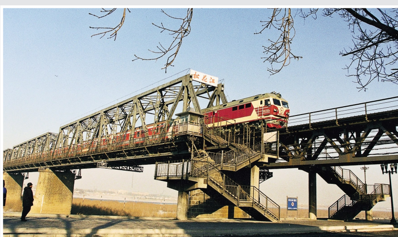
2003年，列车通过“老江桥”。