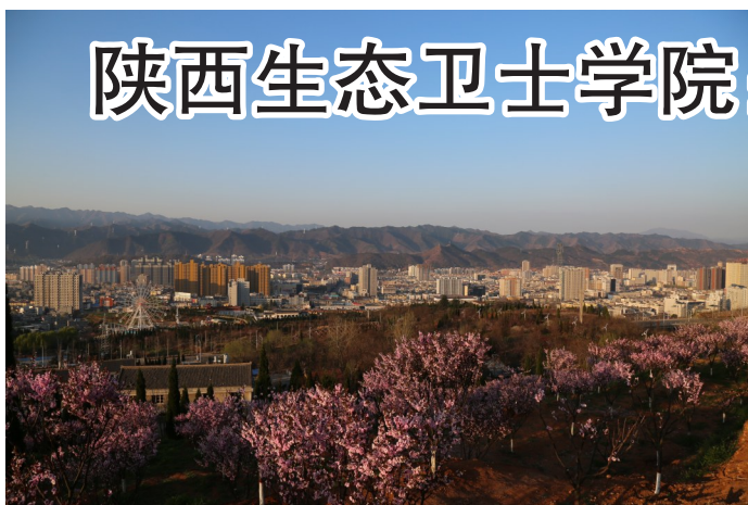
绿树掩映、山花烂漫的商洛城区。