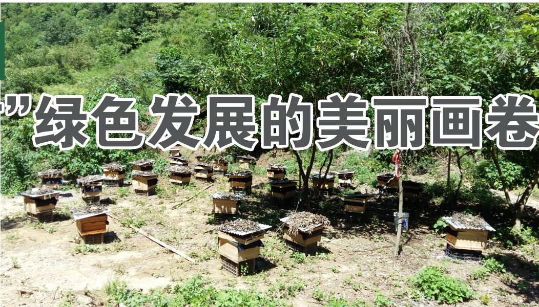
商洛市二郎庙电沟中华蜂养殖基地。