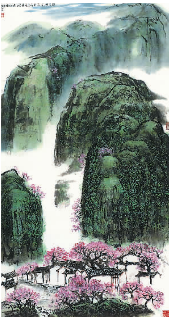
桃李无言花自开(中国画)

我们希望灵魂的写作，伟大灵魂的写作；不是那些所谓的灵魂，仅仅是外界流行的风气的反映而已。乡土文学作家必须对中国文化、欧美文化有所了解，最好对它们的精微之处，它的起承转合，非常复杂的过程，与因之而产生的特质，有一个深切的设身处地的了解。当然，这是非常之难的，但又是非常必要的。鲁迅先生为什么能写出那么优秀或者说伟大的乡土文学，就因为他的博学，他的过人的思想，那双深邃的眼睛是能够纵观千年历史，也能跳出乡土的局限，而进入一个大境界。