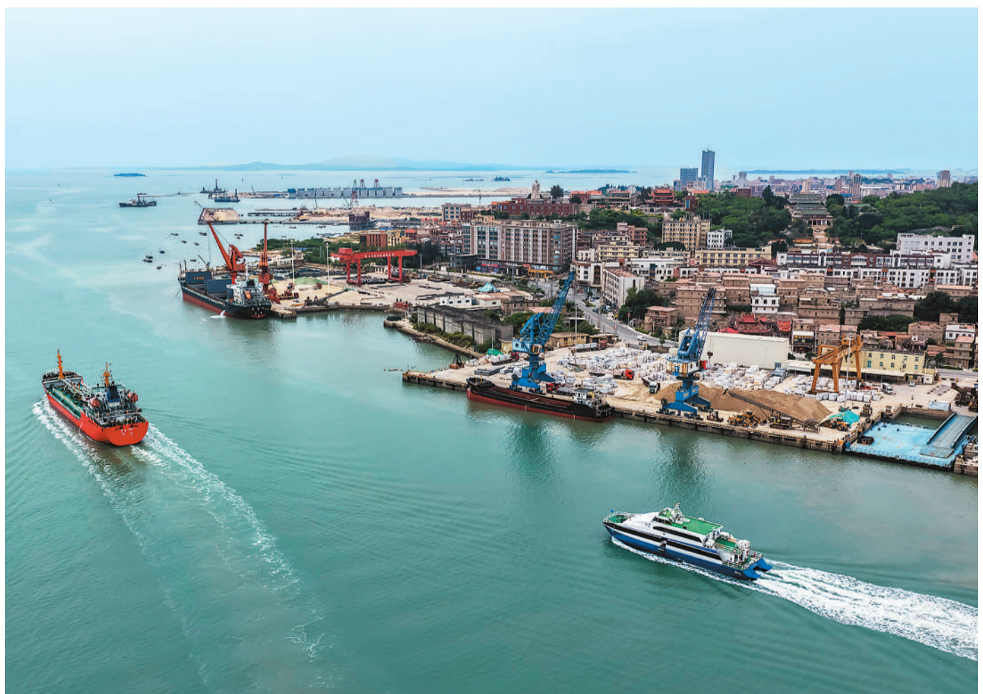
6月2日，福建省南安市的泉金客运码头，经厦门边检总站泉州边检站高效验放保障，承运泉金航线的“八方”轮，搭载两岸乘客驶离码头。泉金航线是连接泉州石井港与金門水头港的海上客运通道，于2006年6月8日开通，航程约21海里（时间约60分钟）。据厦门边检总站泉州边检站统计，截至今年6月，该航线已累计安全运行超3.2万航次，运送旅客总量突破160万人次。

自2016年首届创办以来，东湖交流季已走过十载春秋，成为两岸青年交流交往的平台。截至2025年，活动累计促成1200余名台青在鄂就业创业，130余位台师任教，150多名台医入职湖北医疗机构。