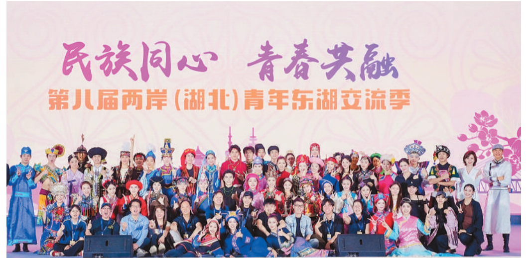
两岸青年代表在开幕式上合影。

以“民族同心 青春共融”为主题的第八届两岸（湖北）青年东湖交流季系列活动近日在湖北举办。包括约500名台湾青年在内的700余名海峡两岸青年齐聚荆楚，访古迹、品非遗，共话创新创业，共叙青春友情。