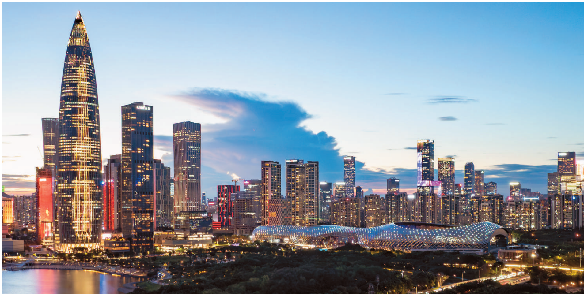
图为位于广东省深圳市南山区的深圳湾体育中心以及周边建筑。