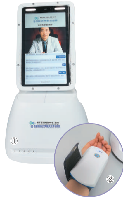
图①：地坛医院中西医结合诊疗智能体“AI王宪波健康助手”问诊示例。

目前，该智能体现已在院内试运行。未来有望以更轻便的形态下沉社区，率先服务于超重人群的减重管理。“AI王宪波”不是要替代我，而是把我的临床经验变得可复制、更普及。”王宪波说。