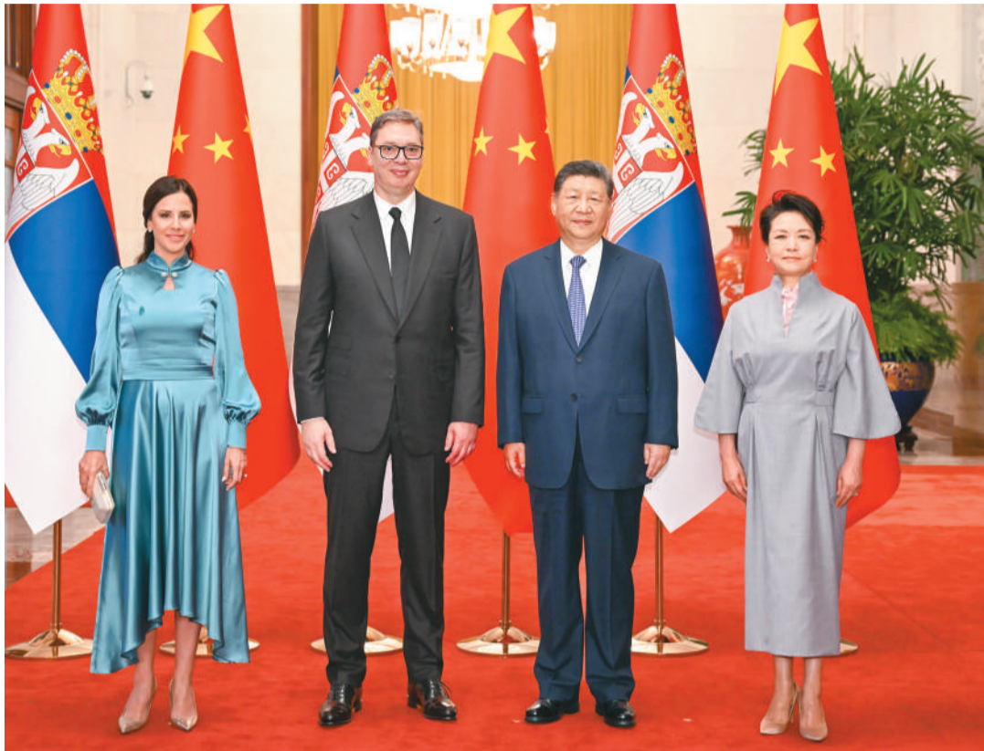
五月二十五日下午，国家主席习近平在北京人民大会堂同塞尔维亚总统武契奇夫妇举行会谈。这是会谈前，习近平和夫人彭丽媛同武契奇和夫人塔玛拉合影。