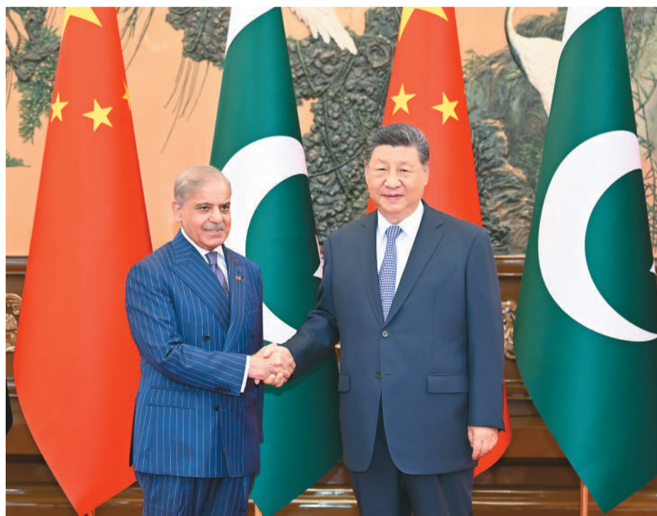
5月25日下午，国家主席习近平在北京人民大会堂会见来华进行正式访问的巴基斯坦总理夏巴兹。

本报北京5月25日电 5月25日下午，国家主席习近平在北京人民大会堂会见来华进行正式访问的巴基斯坦总理夏巴兹。