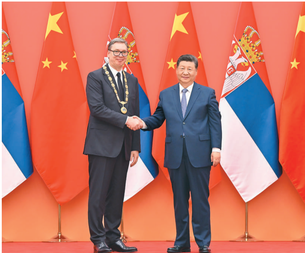
五月二十五日晚，国家主席习近平在北京人民大会堂为塞尔维亚总统武契奇举行“友谊勋章”颁授仪式。

本报北京5月25日电 5月25日晚，国家主席习近平在北京人民大会堂为塞尔维亚总统武契奇举行“友谊勋章”颁授仪式。