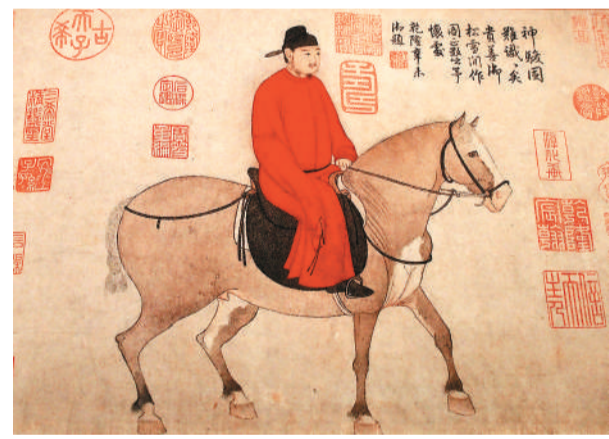
▲元代赵孟頫《人骑图》（局部）。