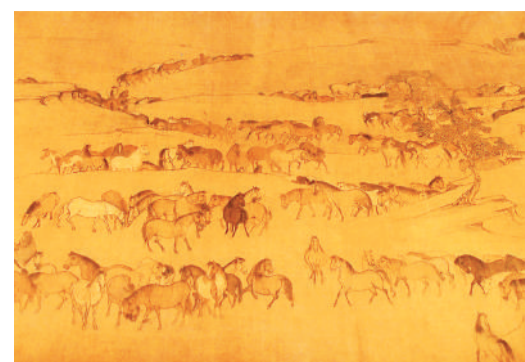
图（局部）。▲北宋李公麟《摹韦偃牧放》

安庆还有“中国院士之乡”的美誉，从这里走出了数十位两院院士，他们为家乡发展贡献智慧，他们的故事在博物馆中展示，让观众感受古今文脉赓续传承。海内外安庆籍企业家心系桑梓，踊跃返乡投资兴业。阔步迈进“十五五”，“有戏安庆”必将迎来“好戏连连”。