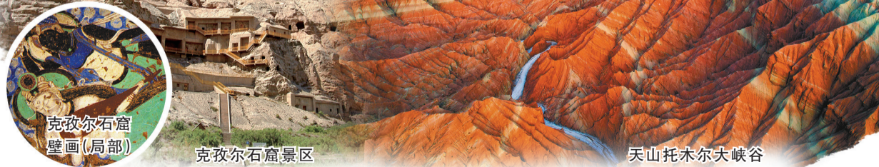
克孜尔石窟壁画（局部）