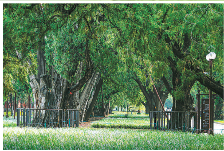
中山公园七棵辽柏