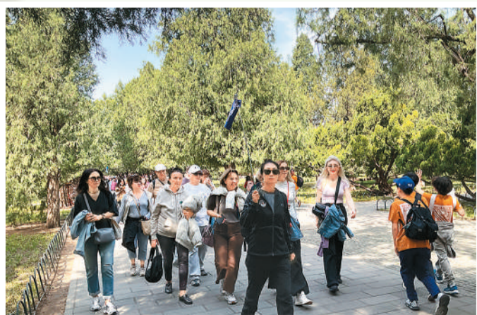
外国游客在天坛公园古树间游览。