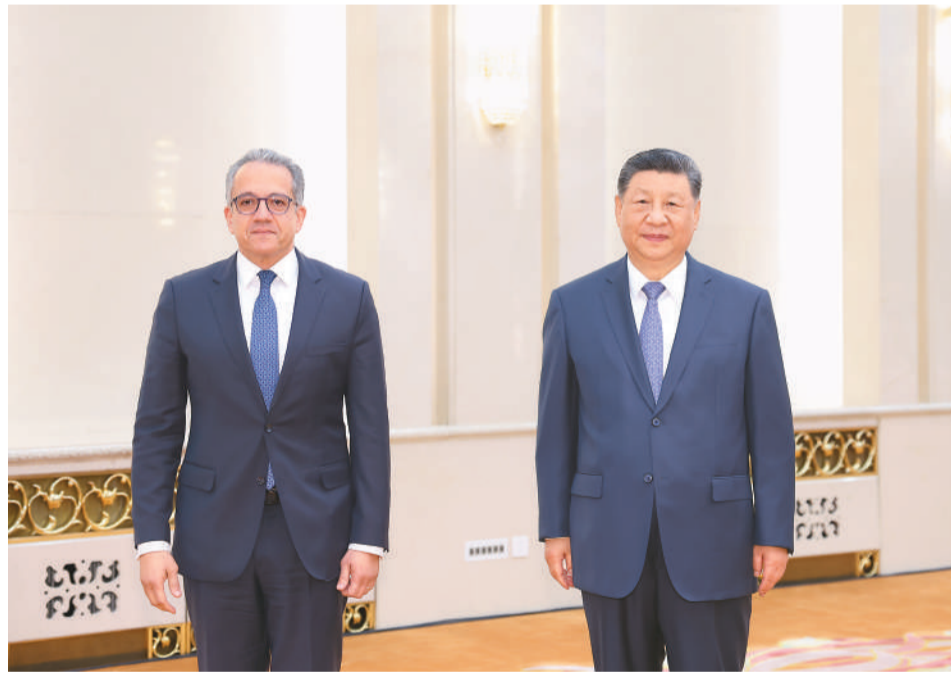
5月12日下午,国家主席习近平在北京人民大会堂会见联合国教科文组织总干事阿纳尼。