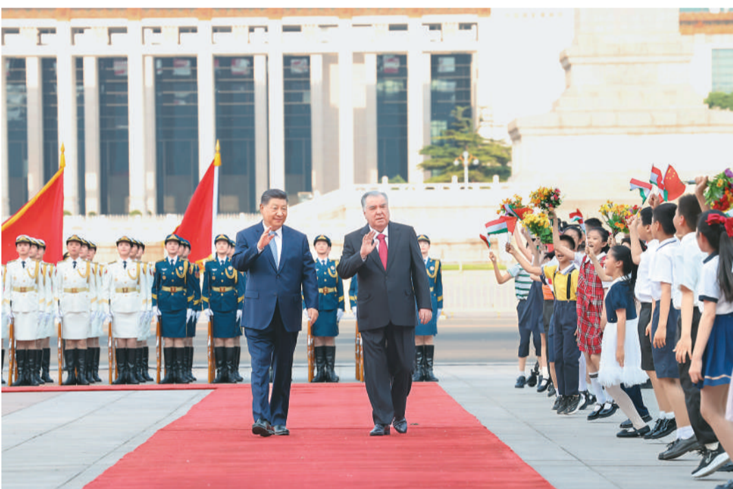
五月十二日下午,国家主席习近平在北京人民大会堂同来华进行国事访问的塔吉克斯坦总统拉赫蒙举行会谈。这是会谈前,习近平在人民大会堂东门外广场为拉赫蒙举行欢迎仪式。

新华社北京5月12日电(记者温馨)5月12日下午,国家主席习近平在北京人民大会堂同来华进行国事访问的塔吉克斯坦总统拉赫蒙举行会谈。