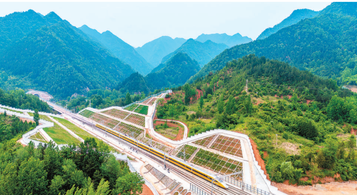
5月12日，西十高铁全线拉通试验启动，全线联调联试工作取得重要进展，为后续试运行和开通运营奠定坚实基础。西十高铁是国家“八纵八横”高铁网重要组成部分，线路建成通车后，西安至十堰将实现1小时内到达，西安至武汉将实现2.5小时左右到达。图为DJ602次综合检测列车行驶在陕西省山阳县境内。