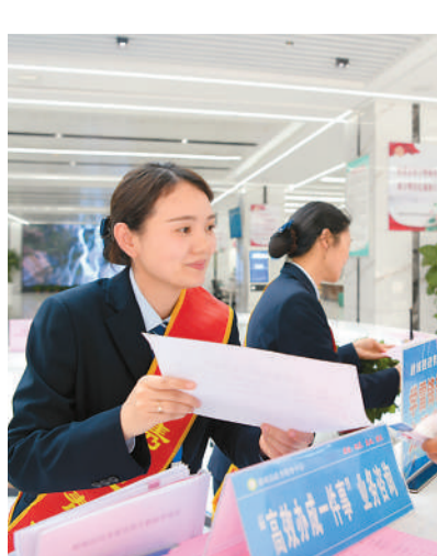
在湖北省咸宁市通城县政务服务大厅，工作人员为市民提供引导服务。

本报北京5月8日电（记者孔德晨）记者8日从国家市场监督管理总局获悉，市场监管部门推进“高效办成一件事”改革成效显著，企业信息变更、注销登记、开办餐饮店、迁移登记和个体工商户转型为企业等“一件事”如期完成，线下办事“只进一门”，线上办事“一网通办”，大幅提升了企业和群众办事满意度、获得感。