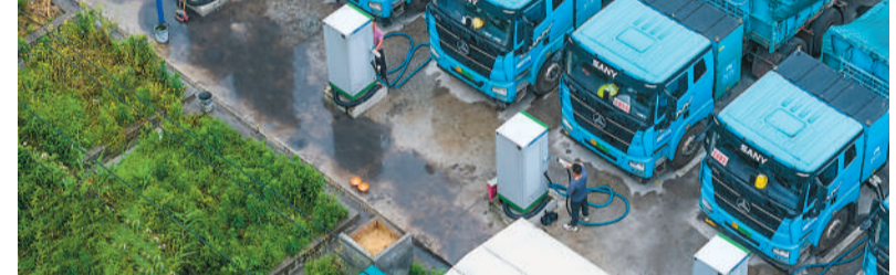
江西省丰城市广泛布局充换电站，新建、改扩建电动重卡停车场，破解电动重卡充电难、停车难等问题，助力电动重卡规模化应用。图为5月7日，在丰城市高新园区某充电站，司机正给电动重卡充电。

国家发展改革委表示，下一步，将会同有关部门聚焦经营主体关心关切，破除卡点堵点、补短板强弱项、巩固拓展优势，积极营造市场化、法治化、国际化一流营商环境，为各类经营主体投资兴业提供广阔空间和坚实保障。