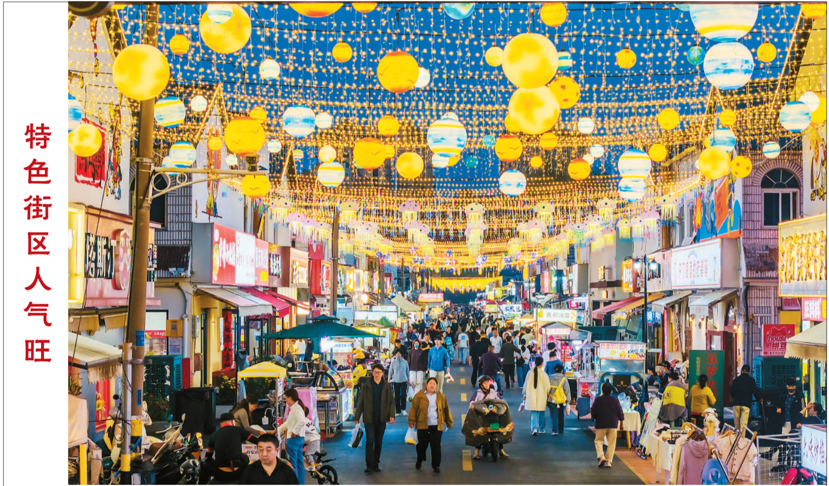
近年来，江苏省宿迁市深挖夜间经济消费潜力，积极打造特色街区，培育“食、游、购、娱”等多元消费新场景，持续激发市场活力，促进商旅文融合创新发展。图为人们在宿迁市宿城区一特色街区休闲游玩。