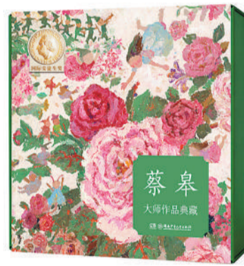
▲《蔡皋大师作品典藏》书封。

对于儿童美育，蔡皋始终主张“润物细无声”，认为美育应融入日常、融入生活，让孩子在潜移默化中感受美、发现美、创造美。“只要孩子拥有一颗热爱生活、感受美好的心，他就拥有了