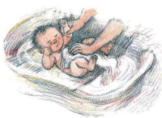
▲绘本《出生的故事》内页。

物时重气韵，女儿则擅长细节塑造，母女二人优势互补，让作品既有历史的厚重感，又有艺术的感染力。