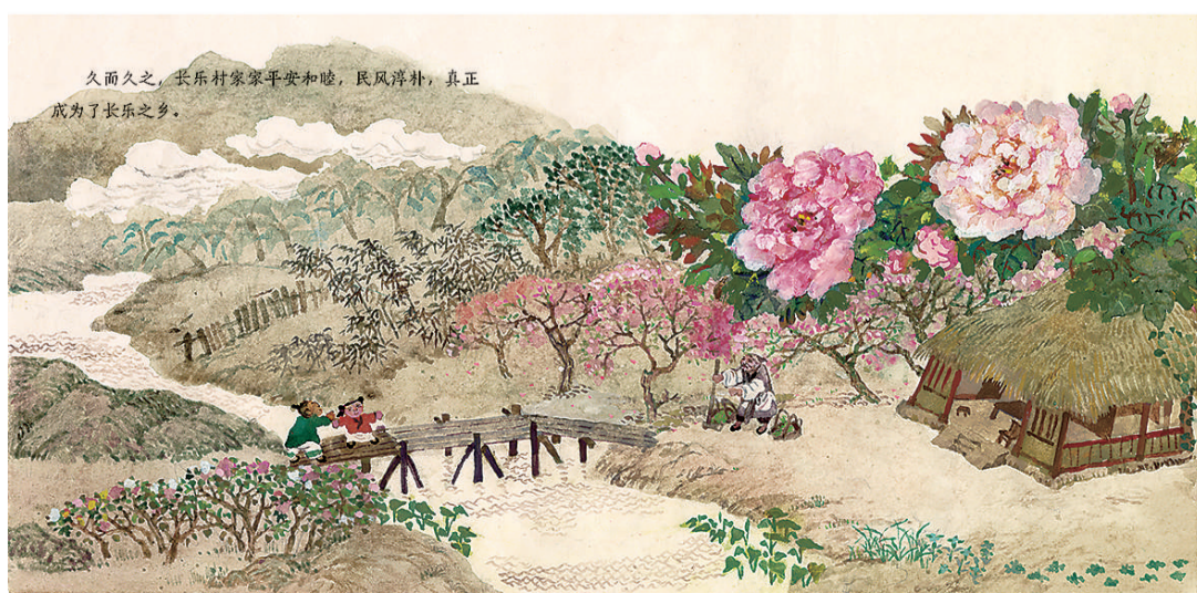
▲绘本《秋翁遇仙记》内页。