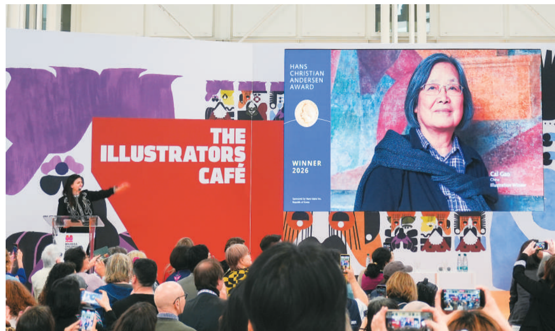
▲中国艺术家蔡皋在意大利博洛尼亚国际儿童书展上荣获2026年国际安徒生奖插画家奖。

蔡皋认为，风格从来不是固化的形式，而是精神内核的自然流露，技法与色彩都要服务于主题，而非刻意彰显个人特色。这一点在《火城1938》中体现得淋漓尽致。这部与女儿合作的作品，以1938年文天大火为历史背景，全书采用木炭、铅笔创作，如旧时的黑白默片，以深沉凝重的画面直击人心。蔡皋认为，战争与灾难题材，不适合用绚烂色彩表达，焦土与沧桑，唯有黑白炭笔能精准传递。她有老长沙生活的生动记忆，画人