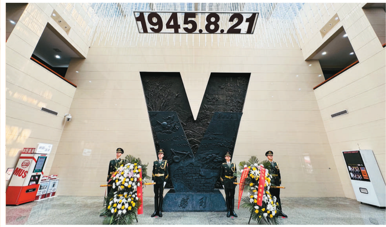
图为与会人员向中国人民抗战胜利受降纪念馆内的胜利V字雕塑献花。