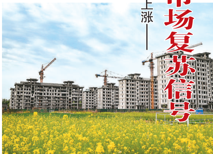
4月16日，山东省青州市某商品住宅楼盘正在施工建设中。

看二手房。3月份，北上广深等主要一线城市二手房销售价格较上月有所上涨。数据显示，3月份，一线城市二手房销售价格环比由上月下降0.1%转为上涨0.4%。其中，北京、上海、广州和深圳分