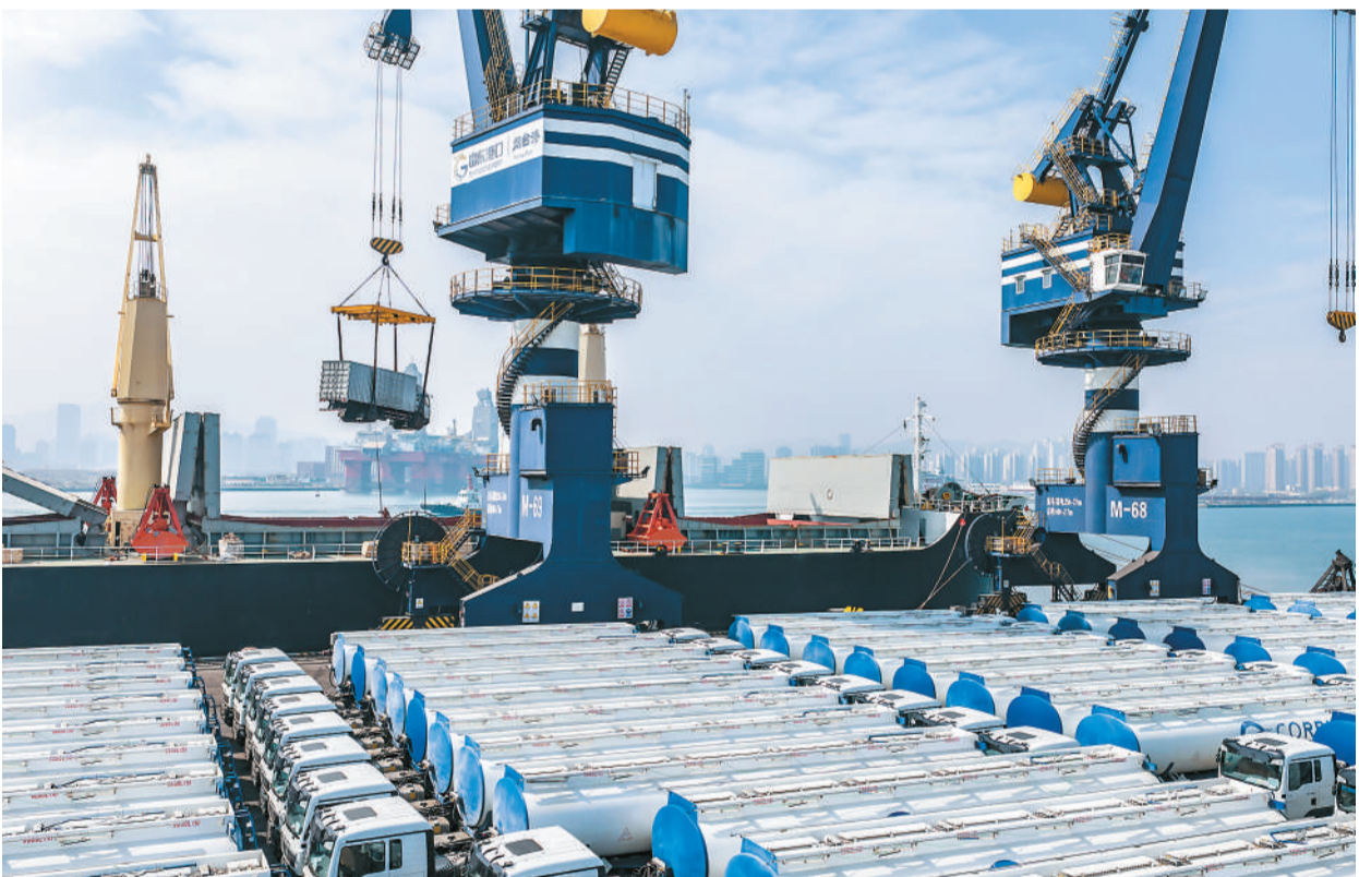
4月13日，出口科特迪瓦的车辆在山东港口烟台港装入中非班轮。近日，货车、油罐车、混凝土搅拌车等车辆在山东港口烟台港陆续装船，准备出口非洲。今年一季度，烟台港中非件杂货班轮航线发运量突破200万吨，同比增长31.9%，运输货种高度契合非洲国家基建和民生需求。

坦，作为习近平主席特别代表出席复兴气田四期项目开工仪式。访土期间，丁薛祥副总理作为中土合作委员会中方主席，将同土方共同主持召开委员会第七次会议。