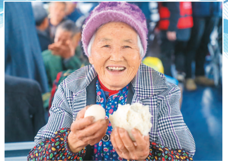
▲3月31日，菜农在船上吃早餐。