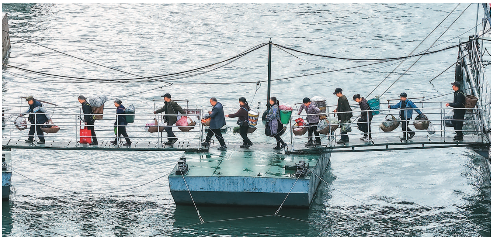
▶3月31日，“新渝忠客2180”客轮抵达忠县县城后，菜农下船前往集市售卖农产品。