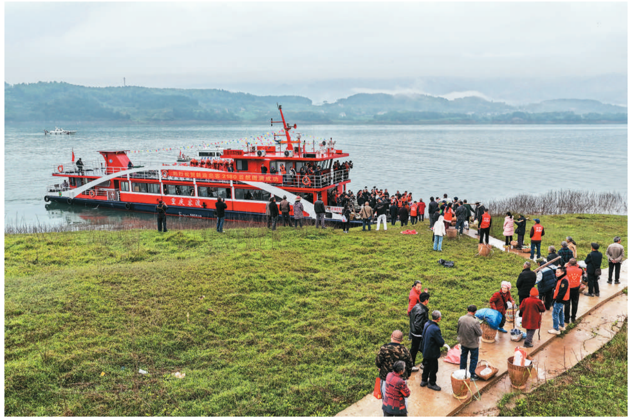
▲3月31日，在长江重庆忠县段，菜农登上“新渝忠客2180”客轮，准备前往县城西山码头。

3月31日清晨6点，细雨轻笼重庆市忠县洋渡镇洋渡码头，新老两艘“渝忠客2180”客轮并肩稳稳停靠在岸边。