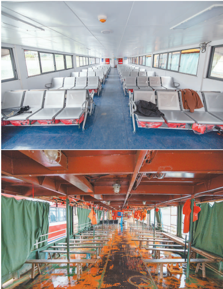
▲上图为“新渝忠客2180”客轮客舱；下图为“渝忠客2180”客轮客舱。