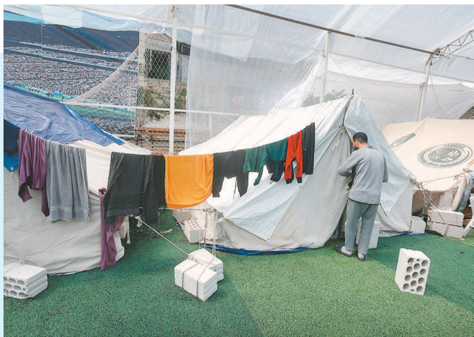
黎巴嫩近年频繁卷入战火,近日真主党与以色列的冲突再度爆发。图为黎巴嫩西顿的一座由足球场改成的临时避难所。