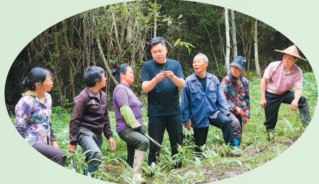
福建省将乐县常口村黄精种植基地内，技术员指导农户种植黄精。