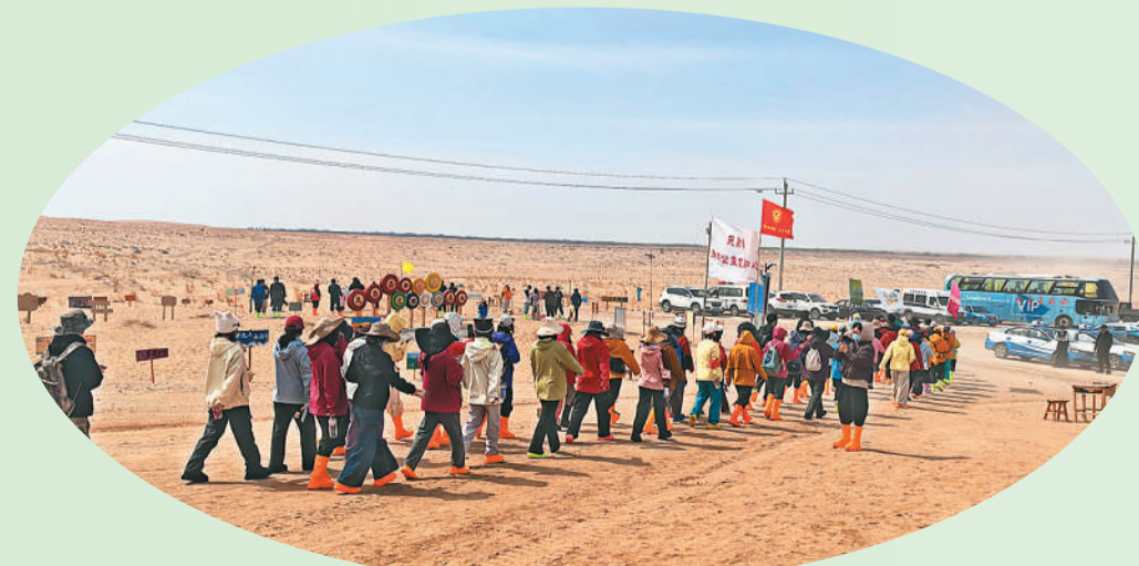
来自全国各地的年轻人相聚甘肃省民勤县，在沙漠中种下梭梭，也种下春天与希望。