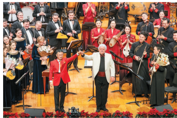
中俄指挥家及乐团同台。

据了解，俄罗斯奥西波夫国立模范民族乐团此行还为中国观众带来了4场浓郁的俄式风情民乐盛宴。