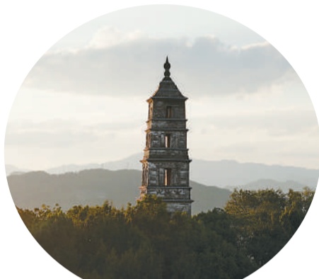
▲临安功臣山功臣塔。