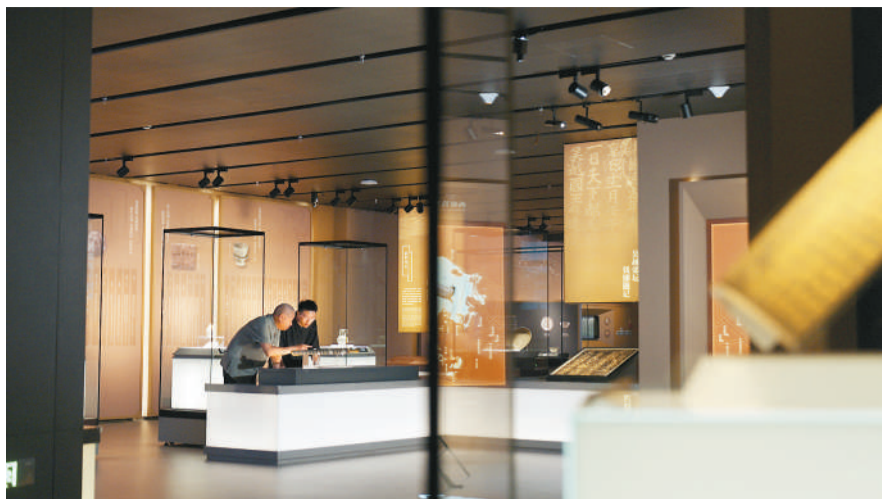
▲主创团队考察临安吴越文化博物馆。

一代人有一代人的大好河山，一代人有一代人的家国天下。日前纪录片《吴越国》播出，用惊艳的影像、灵动的叙事与深刻的思考，讲述了吴越国三世五王的传奇，深刻阐述了中国人之大历史观。