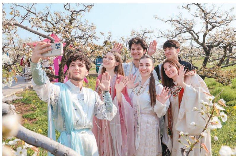
在山东省滕州市柴胡店镇刘村梨园，来自枣庄科技职业学院的外国留学生穿汉服、赏梨花，感受别样春日美景。