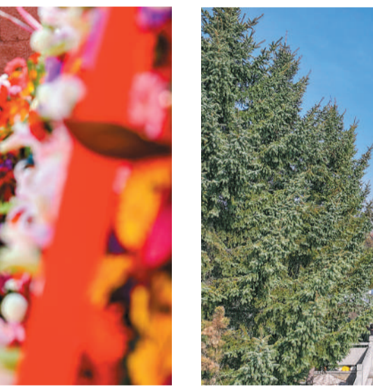
黑龙江省绥化市各界青年代表在革命烈士纪念碑前缅怀革命先烈。

4月3日，“清明节的铭记——缅怀英烈志 奋进‘十五五’”主题教育系列活动启动仪式，在中国人民抗日战争纪念馆隆重举行，首都社会各界群众600余人齐聚现场，共同缅怀革命先烈，凝聚奋进“十五五”的磅礴力量。