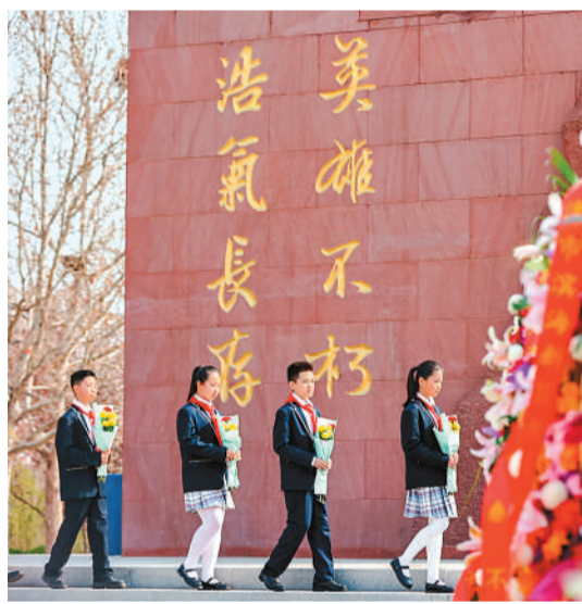
学生在天津市滨海新区塘沽烈士陵园缅怀先烈。

4月3日凌晨，宁夏固原市弘文中学和固原二中的操场上，2000多名学生整齐列队。随着一声“出发”号令，师生们擎起鲜红旗帜，踏上往返50多公里的崎岖山路，徒步前往彭阳县任山河烈士陵园，祭奠长眠于此的烈士。