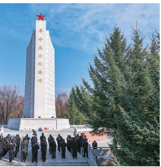
黑龙江省绥化市各界青年代表在革命烈士纪念碑前缅怀革命先烈。

在海南省琼海市的山林深处，一块斑驳的墓碑静卧七十余载，碑文上的“于成久”三个字，被风雨侵蚀得有些模糊。